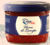
Uova rosse di Lompo 80g - €10,00