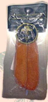
BUGGERRU Bottarga di muggine circa 100g €20,00