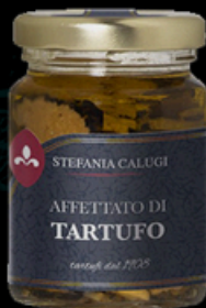
AFFETTATO DI TARTUFO 45g - €17