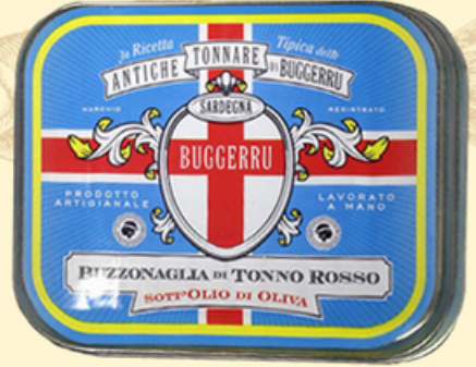
BUZZONAGLIA di Tonno Rosso 340g - €26,00