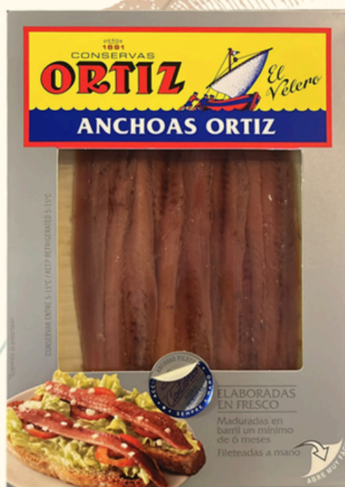
ORTIZ Filetti di Alici 55g in olio di oliva FILETTI EXTRA CANTABRICO €16,00