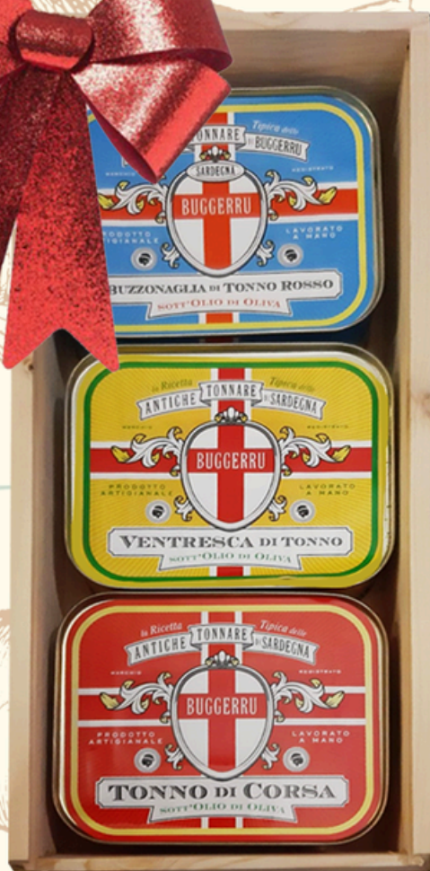
TRIS BUGGERRU Buzzonaglia di Tonno Rosso 340g Ventresca di Tonno 350g Tonno di Corsa 360g €100,00