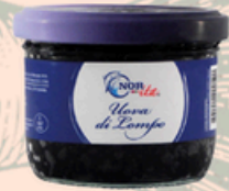
Uova nere di Lompo 80g - €10,00