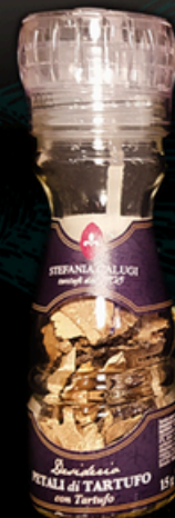
PETALI DI TARTUFO CON TARTUFO 15g - €25,00