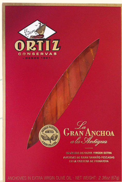
ORTIZ Filetti di Alici 65g in olio di oliva GRAN ANCHOA a la ANTIGUA €20,00