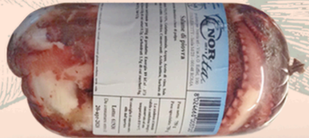
Salame di Polpo €6,00/100g