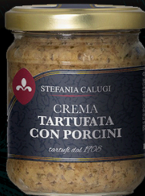
CREMA TARTUFATA CON PORCINI 85g - €10