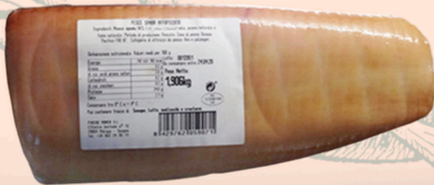
Pesce Spada affumicato €8,00/100g