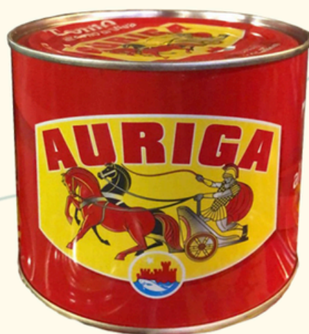
AURIGA tonno 600g - €17,00 tonno 220g - €6,00