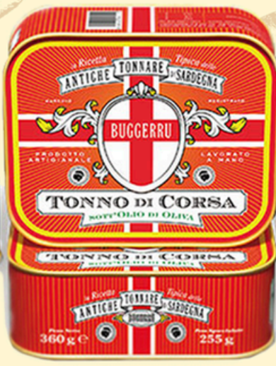
TONNO DI CORSA 360g - €36,00