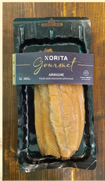
FILETTI DI ARINGA argentata danese affumicata 200g - €10,00