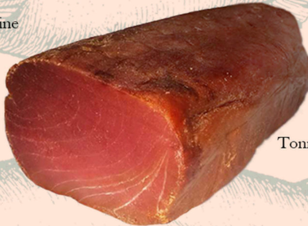
Tonno affumicato €7,00/100g