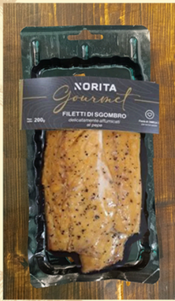
FILETTI DI SGOMBRO al pepe e ai granelli di senape 200g - €12,00