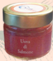
Uova di Salmone Selvaggio 50g - €13,00