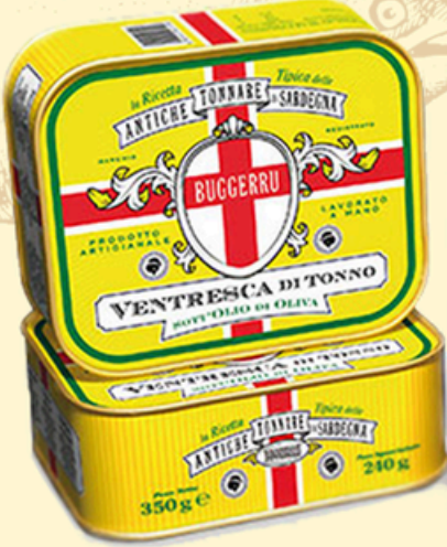
VENTRESCA 350g - €40,00